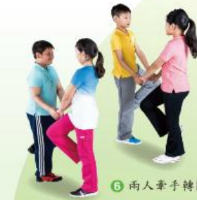
6 兩人牽手轉圈 8 拍，第 7、8 拍做出踏跳步。