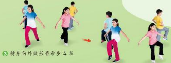
3 轉身向外做莎蒂希步 4 拍