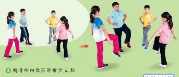
4 轉身向內做莎蒂希步 4 拍

運用基本的隊形與舞序搭配節拍完成七步舞，你也可以更換牽手繞圈的方向或走步的前後順序，讓你的七步舞更活潑！