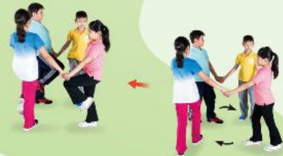
5 四人牽手順時鐘方向繞圈 8 拍，第 7、8 拍做出踏跳步。