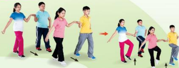
1 向前走步 8 拍，第 7、8 拍做出踏跳步。