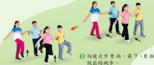
2 向後走步 8 拍，第 7、8 拍做出踏跳步。