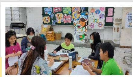
張明文局長蒞校幫選手們加油打氣!!