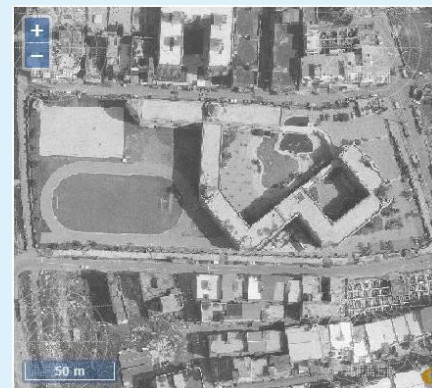
82年成功校園空拍圖