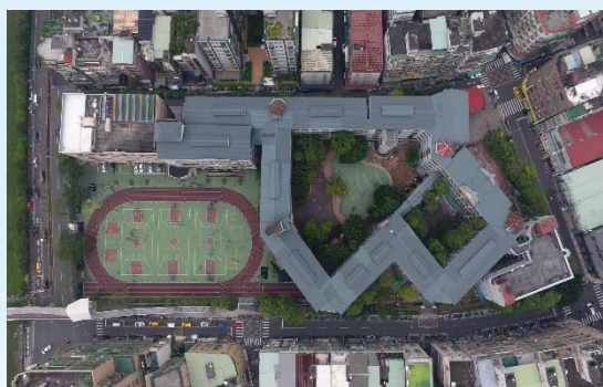
110年成功校園空拍圖

隨著蘆洲人口的移入，學生人數也不斷地成長，2000年時成為當時台灣學生人數最多的小學，為了滿足孩子上課的迫切需要，成功校園中一棟棟的校舍陸續興建落成。